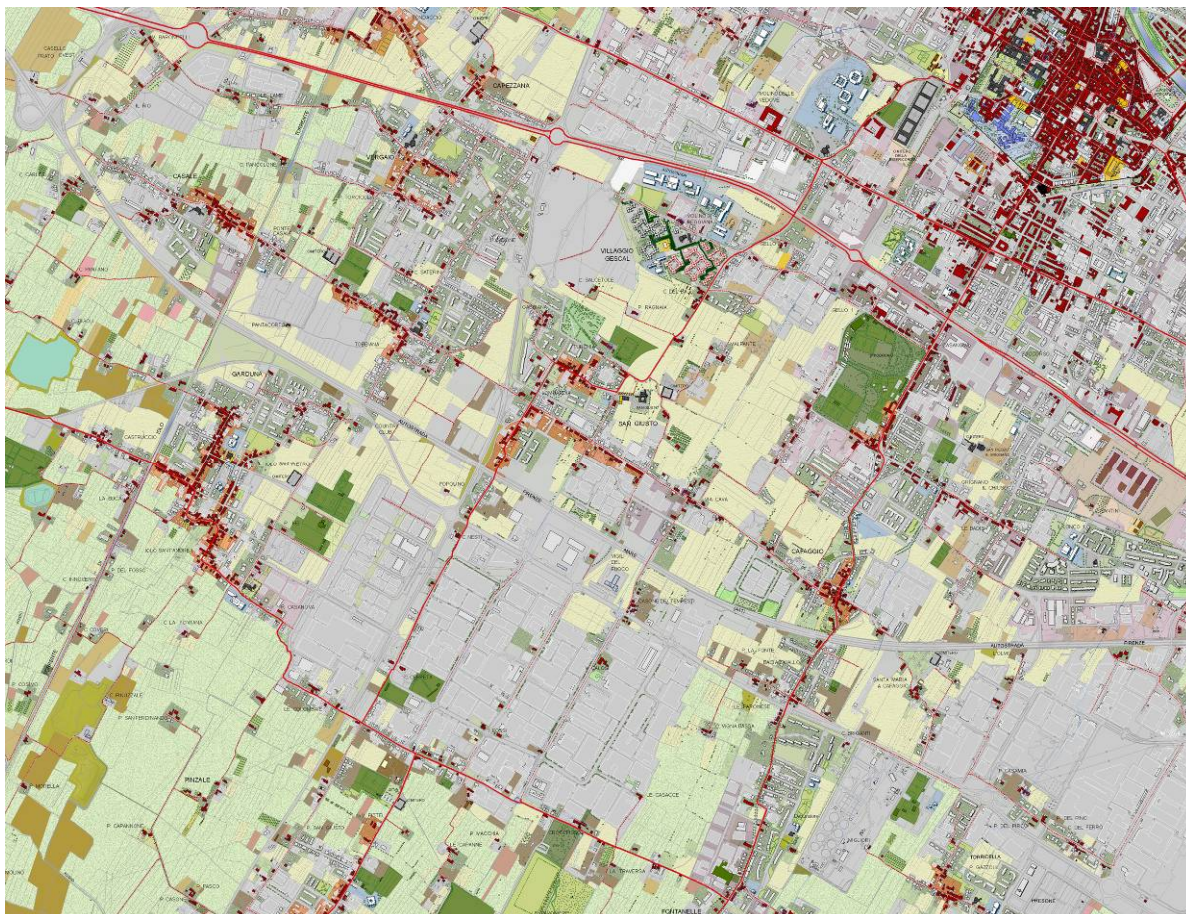
Fig. 2. Prato: estratto della carta del patrimonio territoriale